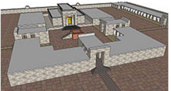
ព្រះវិហារសាឡូម៉ូន